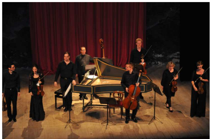
Abschlusskonzert im Teatro Poliziano

Mit vereinten Kräften unter Zuhilfenahme der Fangruppe musste zunächst das Cembalo von der Akademie zum Theater transportiert werden. Im Rahmen der Generalprobe waren dann noch Probleme mit der trockenen Akustik sowie dem schrägen Bodens zu überwinden. Etwa 120 begeisterte Zuschauer konnten dann am Abend nach einem kurzen erfrischenden Gewitter erleben, welche großartige Wirkung Landschaft, Arbeitsatmosphäre sowie engagierte Musiker haben können.