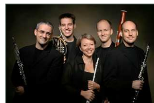
Ensemble Pentaèdre

mit dem Ensemble Pentaèdre Franz Schubert: „Winterreise“ So 13. März 2011, 19.00 Uhr Philharmonie Mercatorhalle