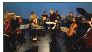
ensembleKONTRASTE, Foto: Uwe Dlouhy

mit dem ensembleKONTRASTE So 24. Oktober 2010, 19.00 Uhr Wilhelm Lehmbruck Museum