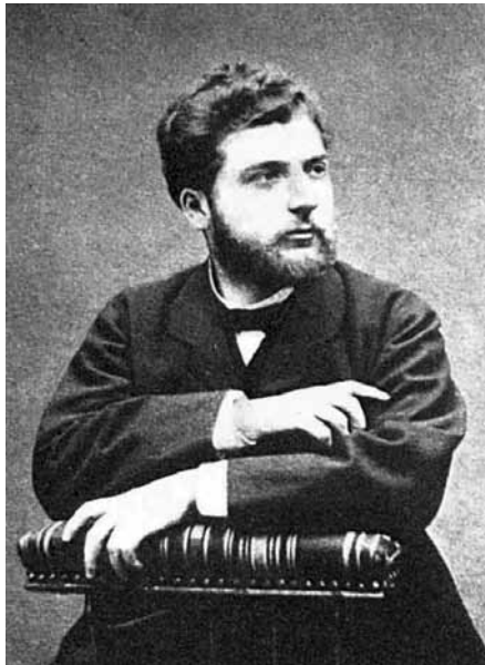
Georges Bizet, etwa 1860

Guss wirkt die frühe Sinfonie von Georges Bizet, und wenn das Werk formal nicht aus dem Rahmen fällt, so wirken doch die Selbstverständlichkeit der thematischen Erfindung und die transparente Instrumentierung unmittelbar für sich einnehmend. Am Beginn steht ein Sonatensatz, der den üblichen Themenkontrast aufweist, denn dem energischen Hauptgedanken steht ein melodisch weit gesponnenes Thema zur Seite. Der langsame Satz ist ein schöner Ruhepunkt. Die Anfangstakte bauen zunächst die Spannung auf und nehmen ein rhythmisches Motiv des Hauptgedankens vorweg. Dieses weit gesponnene Thema mit seinen orientalischen Anklängen wird zur Begleitung der gezupften Streicher von der Oboe vorgetragen. Auch der sich anschließenden Streicherkantilene ist jede Schwere genommen, während ein Fugato-Abschnitt vielleicht etwas schematisch geraten ist. Das Scherzo lässt ebenfalls sicheres Beherrschen des Kompositionshandwerks erkennen, es spielt mit dem Wechsel von robusten und gesanglichen Einfällen, und das von Bordunquinten grundierte Trio zeigt sogar eine thematische Verbindung mit dem Hauptteil. Unwiderstehlich ist dann die Vitalität des motorisch geprägten Finalsatzes.