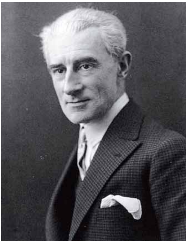
Maurice Ravel, 1925

„Ravel, das ist ein Meisterwerk, es ist das Gemälde ... das Abbild eines Balletts“. Dieses Urteil führte den unwiderruflichen Bruch zwischen Ravel und Diaghilew herbei. Der Komponist zog seine Partitur deshalb zurück. Nachdem die Fassung für zwei Klavier am 23. Oktober 1920 bezeichnenderweise in Wien Premiere hatte, stellten Camille Chevillard und das Orchestre Lamoureux am 12. Dezember 1920 in Paris die Orchesterfassung vor. Wurde die Musik zunächst als „lächerlich“ und „belanglos“ abgelehnt, setzte der Siegeszug bereits ein Jahr später ein. Am 2. Oktober 1926 war „La Valse“ in Antwerpen erstmals auch auf der Tanzbühne zu erleben.