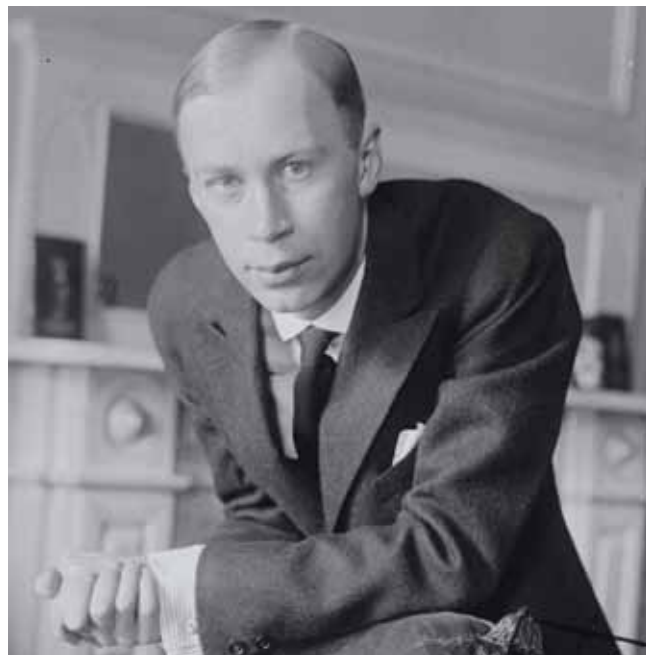
Sergej Prokofjew 1918 in New York

Im Zuge neoklassizistischer Bewegungen ist die „ Symphonie classique “ keine bloße Stilkopie. Dies zeigt sich auch darin, dass das traditionelle Menuett durch die ältere barocke Gavotte vertreten wird. Von Joseph Haydn jedenfalls ist keine einzige Gavotte bekannt. Und mag auch der Kopfsatz an die „ Londoner Sinfonien “ des Klassikers erinnern, so gibt es zusätzlich sowohl Anlehnungen an die Musik der Barockzeit als auch an die frühen Sinfonien Ludwig van Beethovens. Das in hoher Lage vorgetragene Thema des Larghetto-Satzes besitzt romantischen Ausdruck, und hinter der Fassade eines mitreißenden Kehraus-Finales verbirgt sich nichts anderes als ein moderner Galopp.