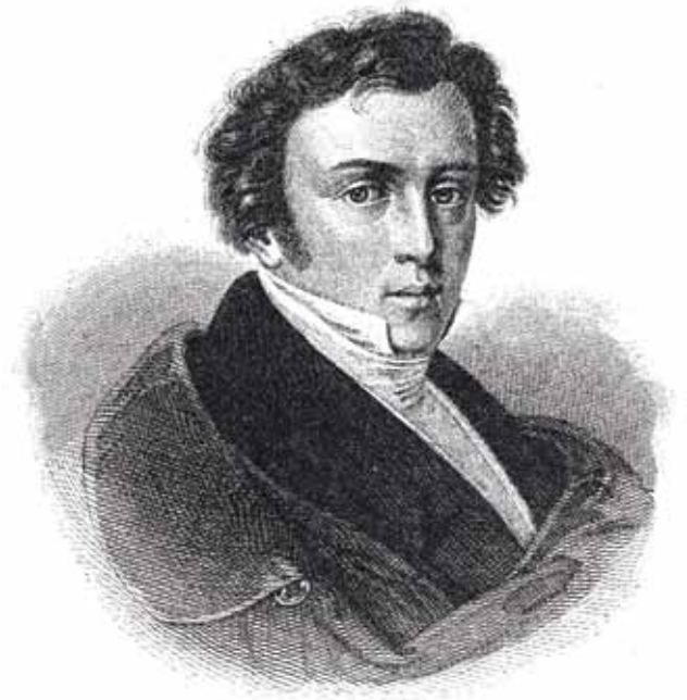
Der Dichter Wilhelm Müller

Die zweite Abteilung der „ Winterreise “ erschien dann erst am 31. Dezember 1828, also kurz nach dem Tod des Komponisten: Franz Schubert starb am 19. November 1828.