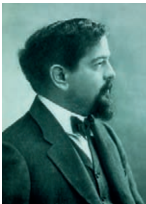
Claude Debussy, 1908

Auf dem Gebiet der Klaviermusik hat der Franzose Claude Debussy einen bemerkenswert eigenständigen Stil gefunden. Der Komponist war selbst auch ein ausgezeichneter Pianist. Dennoch datieren seine ersten bedeutenden Klavierwerke aus dem Jahr 1903, als die Oper „ Pelléas et Mélisande “ sowie die Orchesterstücke „ Prélude à l'après-midi d'un faune “ und „ Nocturnes “ bereits vorlagen. Es zeigt sich, dass der Klavierkomponist Claude Debussy auf Errungenschaften aufbauen