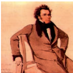
Franz Schubert, Aquarell von Wilhelm August Rieder, 1825

Die drei späten Klaviersonaten sind besonders bekannt geworden: Die Sonaten c-Moll D 958, A-Dur D 959 und B-Dur D 960 gelten als Franz Schuberts bedeutendste Leistung auf diesem Gebiet, hat der Komponist sich doch hier von dem übermächtigen Vorbild Ludwig van Beethovens zu lösen verstanden und Werke von höchster Individualität geschaffen. Die Schönheit dieser Musik, aber