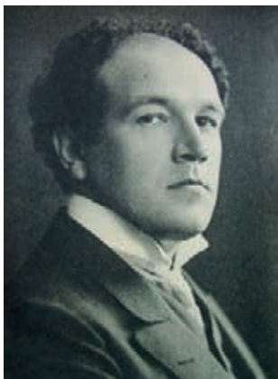
Nikolai Medtner, um 1910

Eine Klaviersonate mit einer Aufführungsdauer von annähernd 35 Minuten darf als eine Komposition von stattlichen Dimensionen gelten. Aber solche Ausdehnungen kommen vor, und in dieser Hinsicht fällt Nikolai Medtner's Klaviersonate op. 25 Nr. 2 zunächst einmal gar nicht aus der Reihe. Einige Schwierigkeiten lassen sich jedoch nicht verkennen. Während in einer Sonate nämlich normalerweise drei bis vier verschiedenartige Sätze für Abwechslung und Übersicht-