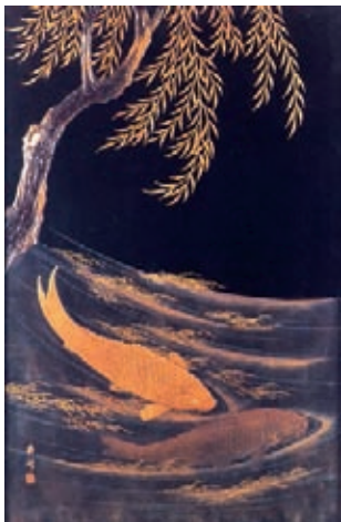
Die chinesische Lackarbeit, die als Vorlage zu Claude Debussys „Poissons d'or“ diente

Der mit Debussy befreundete Musikwissenschaftler Louis Laloy beschreibt für das erste Stück folgenden inhaltlichen Bezug: Das Klavierstück beschreibe „den ergreifenden Brauch des Totengeläuts, das von der Vesper an Allerheiligen bis zur Totenmesse an Allerseelen andauert, von Dorf zu Dorf sich fortsetzt und durch die abendliche Stille der sich verfärbenden Herbstwälder geht.“ Das Mittelstück soll entweder von einem chinesischen Gedicht oder von einem „schillernden Indien à la Kipling“ inspiriert worden sein, doch führt die Komposition auf jeden Fall in den