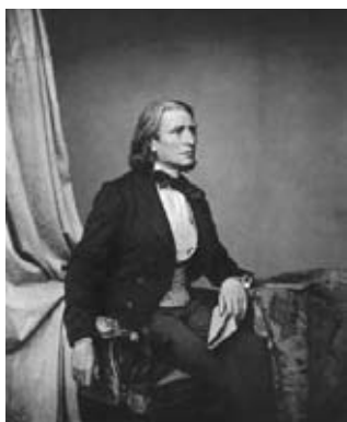
Franz Liszt, 1858

Wie Franz Liszt sich von der Musik der Vergangenheit inspirieren ließ, wurde im Zusammenhang mit den „Episoden aus Lenaus ‚Faust‘“ bereits gesagt. Als nicht weniger reizvoll erwiesen sich die folkloristischen Anregungen. So hatten die gelegentlichen Ungarn-Aufenthalte einen erstaunlichen Nebeneffekt: Der Komponist und Instrumentalvirtuose interessierte sich nun für die Musik seines Geburtslandes.