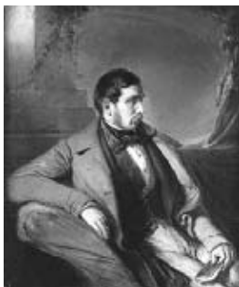
Nikolaus Lenau, Gemälde von Johann Umlauf, ca. 1844

Nikolaus Lenaus „ Faust “ unterscheidet sich grundlegend von dem bekannteren Werk Johann Wolfgang von Goethes. Die Dichtung des Österreichers ist in gewisser Weise radikaler. Faust vertritt nicht länger ein allgemeingültiges Prinzip, das sich auf andere Menschen übertragen lässt, während die Gestalt des Mephistopheles sich auf das Böse konzentriert und weniger intellektuell angelegt ist.