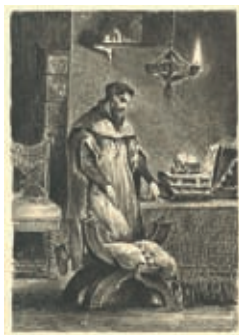
Faust in seinem Studierzimmer, Zeichnung von Eugene Delacroix, 1827