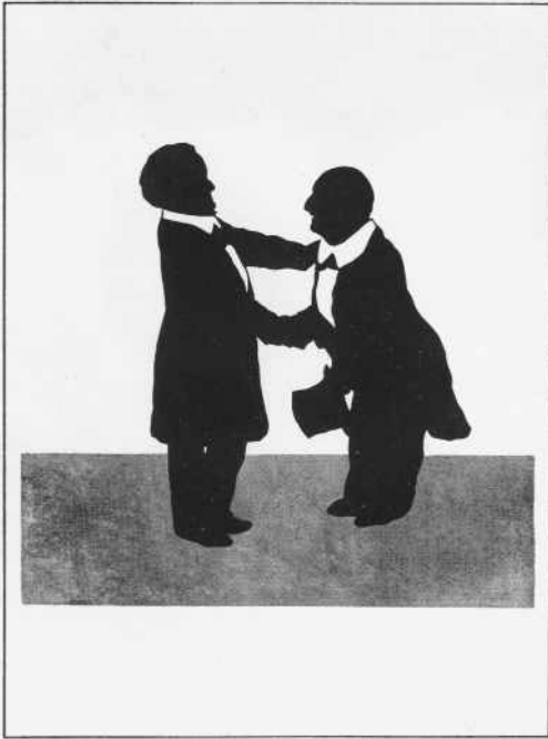
Wagner und Bruckner in Bayreuth auf einem Schattenbild von Otto Böhler.