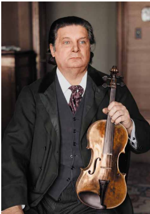
Ein Revolutionär an der Geige: Eugène Ysaÿe (Fotografie zwischen 1915 und 1920)