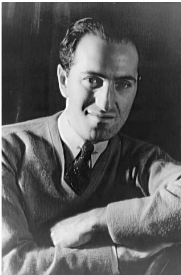
Erfolgskomponist mit sozialem Gewissen: George Gershwin (1937)