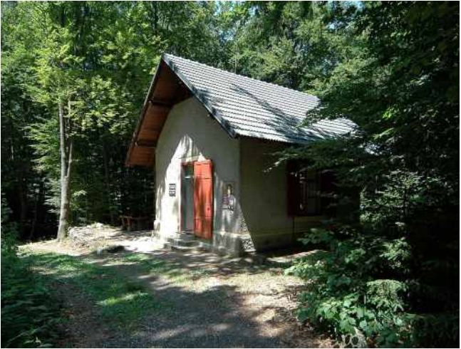
Rückzugsort: Mahlers Komponierhäuschen in Maiernigg.