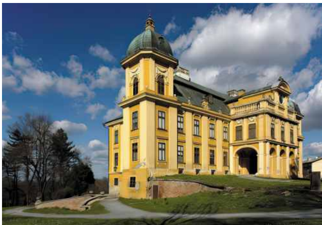
Das Schloss der Familie Pejačević im kroatischen Našice.

wird. Auch Richard Wagner übt eine große Faszination auf sie aus, sie reist nach Bayreuth und nennt ihren Komponierpavillon im heimischen Parkt „Wahnfried“, so wie Wagner sein Wohnhaus am Rande des Bayreuther Hofgartens.