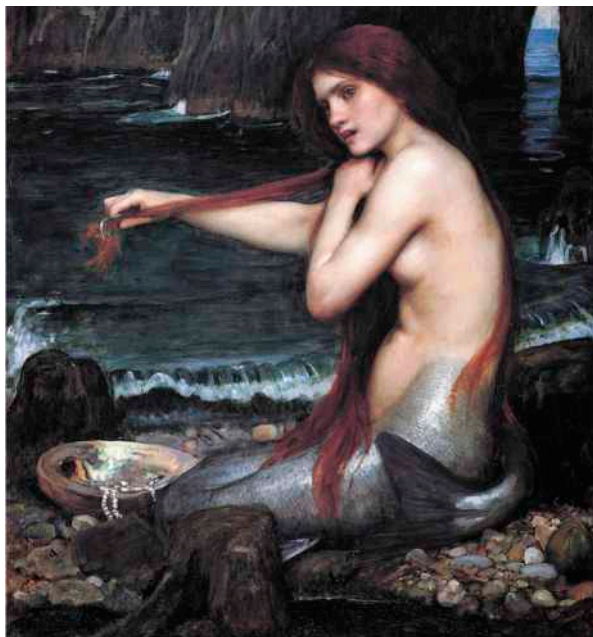
John William Waterhouse: A Mermaid