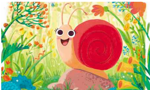
Illustration: Lisa Hänsch, Ramona Wultschner