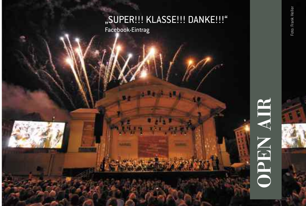
„SUPER!!! KLASSE!!! DANKE!!!“ Facebook-Eintrag