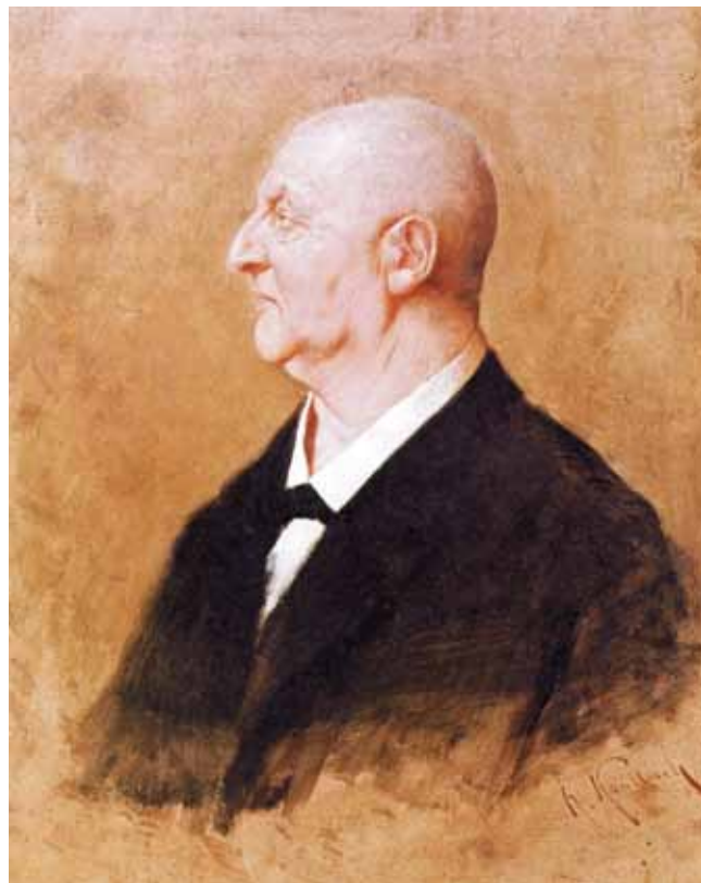
Anton Bruckner, Gemälde von Hermann von Kaulbach, 1885

Der Komponist Anton Bruckner verstand seine eigene Position in der Musikgeschichte genau zu definieren. Deshalb gibt es mehr oder weniger deutliche Anlehnungen an Meisterwerke der Vergangenheit, außerdem verweist die Einbeziehung von Bläserchorälen auf den Bereich des Erhabenen. Unterschwellige Anlehnungen gibt es vor allem an die Sinfonien von Ludwig van Beethoven und Wolfgang Amadeus Mozart, ferner an die geistliche Musik von Mozart und Franz Schubert. Wenn Bruckner in der Adagio-Einleitung des ersten Satzes das Pizzicato der tiefen Streicher mit dem Thema der Violinen und Violen kombiniert, so lassen die eigentümlichen Sekundvorhalte an den Beginn des Mozart-„Requiems“ denken – für den Anfang des langsamen Satzes hat dieses Modell noch deutlicher als Vorla-