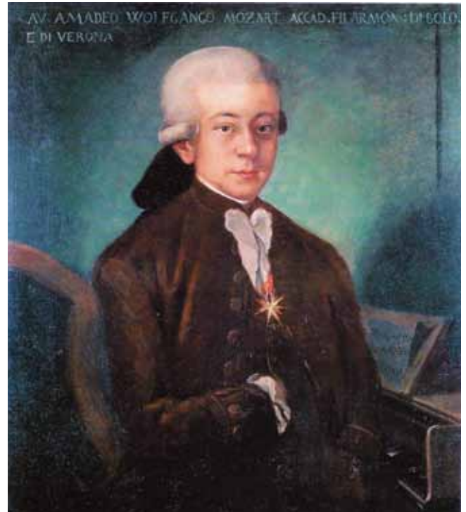
Wolfgang Amadeus Mozart als Ritter vom Goldenen Sporn, anonymes Ölgemälde, Bologna 1777

An größeren Werken entstanden in der französischen Hauptstadt nachweislich die „ Pariser Sinfonie “ D-Dur KV 297, das Konzert C-Dur für Flöte, Harfe und Orchester KV 299 und die Ballettmusik „ Les petits riens “ KV 299b. Es ist allerdings von einem weiteren Kompositionsprojekt zu berichten. Am 5. April 1778 informierte Wolfgang Amadeus Mozart seinen Vater: „ Nun werde ich eine sinfonia concertante machen, für flauto wendling, oboe Ramm, Punto waldhorn, und Ritter Fagott. Punto