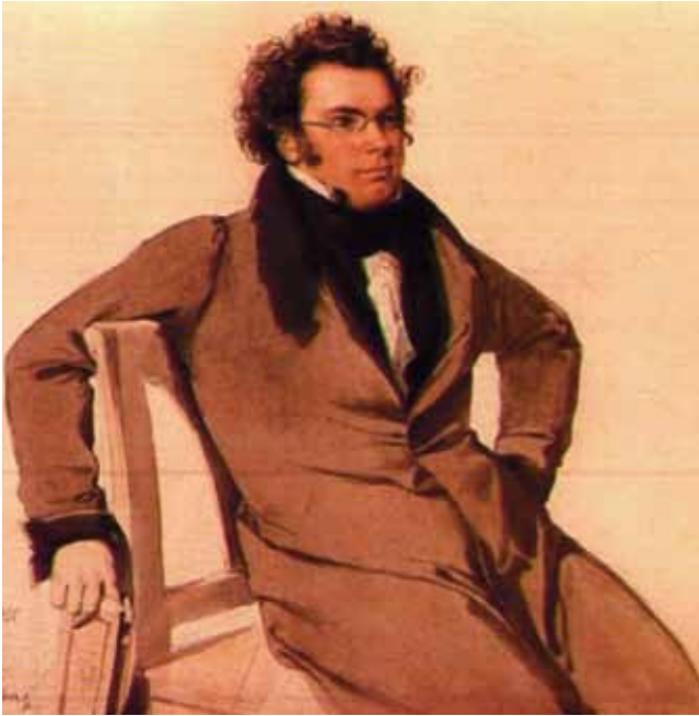
Franz Schubert, Aquarell von Wilhelm August Rieder, 1825