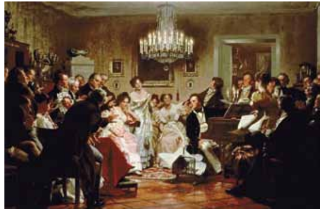
Schubertiade, Ölgemälde von Julius Schmid, 1897

Franz Schubert gehört zu den ganz großen Komponisten der Musikgeschichte. Dass ihm die großen Säle zu Lebzeiten weitgehend verschlossen blieben, mag verschiedene Ursachen gehabt haben. Seine persönliche Bescheidenheit wird dabei eine Rolle gespielt haben, doch gilt auch zu berücksichtigen, dass er sich vielfach mit kleinen Besetzungen und kleinen Formen beschäftigte. Auch dieses konnte sich der Aufführung im großen Rahmen regelrecht widersetzen. Aber Franz Schubert hatte einen Freundeskreis, der das Talent des Musikers zu schätzen wusste und den Musiker, der keine feste Anstellung hatte, nach Kräften unterstützte. Im privaten Rahmen des Freundeskreises wurden „Schubertiaden“ veranstaltet, bei denen Lieder und Instrumentalkompositionen des Musikers erklangen, bei denen aber auch die Geselligkeit nicht zu kurz kam. Schubert selbst begleitete die Vokalwerke am Klavier und spielte gelegentlich auch zum Tanz auf.