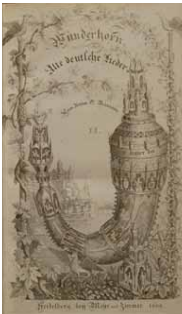
Ein Text aus der Sammlung „Des Knaben Wunderhorn“ fand Eingang in Mahlers dritte Sinfonie.