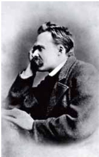
Im vierten Satz seiner dritten Sinfonie vertonte Gustav Mahler einen Text des Philosophen Friedrich Nietzsche.

Es ist bekannt, dass Mahler zunächst mit der Konzeption des zweiten Satzes begann, den er später sein „Blumenstück“ nannte. „Gleich am ersten Nachmittage, als er aus seinem Häuschen auf die Wiese hinaussah, wo es in Gras und Blumen ganz eingebettet liegt, ward es entworfen und in einem Zuge zu Ende geführt“ , weiß Natalie Bauer-Lechner. Anschließend wurden die weiteren Sätze der zweiten Abteilung in Angriff genommen, wobei das „Mitternachtslied“ mit dem Text von Friedrich Nietzsche erst zu einem relativ späten Zeitpunkt hineingenommen wurde. Erstaunlicherweise wurde der Kopsatz der Sinfonie erst im Sommer 1896 ausgearbeitet, also nach den folgenden Sätzen und nach den 1893 in Steinbach hierzu notierten marschartigen