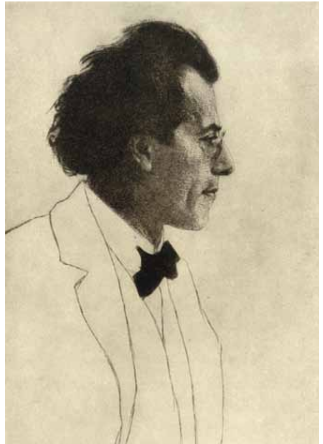
Gustav Mahler, Radierung von Emil Orlik, 1902

Die dritte Sinfonie von Gustav Mahler ist ein Werk der Superlative. Das betrifft nicht nur die Ausdehnung des ersten Satzes, denn mit insgesamt sechs Sätzen geht die Komposition so weit wie keine andere Mahler-Sinfonie über die herkömmliche Satzzahl hinaus. Das Werk hat eine große Instrumentalbesetzung und bezieht auch Singstimmen ein. Das geschieht jedoch grundsätzlich anders als bei jenen Werken, die im Gefolge von Ludwig van Beethovens neunter Sinfonie entstanden, denn bei Gustav Mahler krönen die Singstimmen nicht das Finale, sondern kommen im vierten und fünften Satz zu Gehör. Allerdings erfolgt eine Reduzierung auf Altstimme, Frauen- und Kinderchor, und überhaupt vereint Gustav Mahlers dritte Sinfonie sehr gegensätzliches Material. Ist der Text des vierten Satzes aus Friedrich Nietzsches „Also sprach Zarathustra“ gewählt, so ist der folgende Satz mit einem Text aus der Sammlung „Des Knaben Wunderhorn“ dem Kinderlied angenähert. Das Finale kennt dagegen den Tonfall des Hymnischen, doch handelt es sich hier eben um eine instrumentale Hymne. Überhaupt vereint Gustav Mahlers dritte Sinfonie sehr verschiedenartiges Material. Erhabenes findet sich hier ebenso wie Triviales, und es waren diese Gegensätze, mit denen Gustav Mahler eine umfassende Welt in Tönen bildete, mit denen er das Publikum jedoch zutiefst irritierte und verunsicherte.