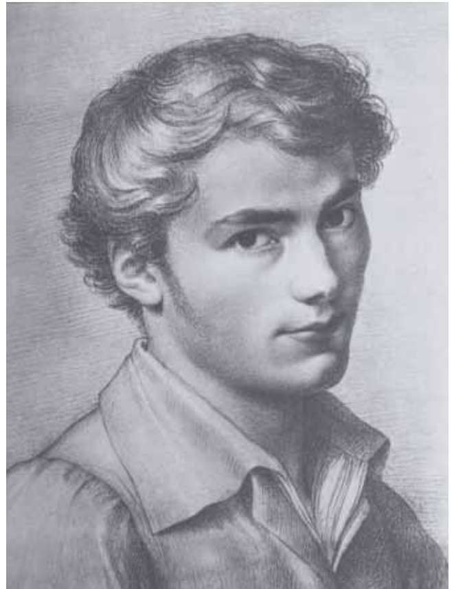
Der sechzehnjährige Franz Schubert, Lithographie von Leopold Kupelwieser, 1813

Am 30. September 1808 war Franz Schubert in das Wiener Stadtkonvikt aufgenommen worden. Seit Juni 1812 erhielt er Kontrapunktunterricht bei Antonio Salieri, und ein gutes Jahr später wurde im Oktober 1813 die erste Sinfonie D-Dur D 82 vorgelegt. Zu dieser Zeit verließ Schubert das Stadtkonvikt, wechselte zur Lehrerbildungsanstalt und wurde 1814 Schulgehilfe an der Schule seines Vaters. Am 24. März 1815 wurde die zweite Sinfonie B-Dur D 124 vollendet, und