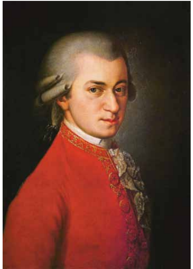
Wolfgang Amadeus Mozart, Ölgemälde von Barbara Krafft, 1819

Im Mittelpunkt dieser Oper, mit der Mozart sich von allen bestehenden Konventionen löste und ein Werk von höchster Eigenständigkeit vorlegte, steht der kretische König Idomeneo, der um Troja kämpfte und in einem Seesturm gelobte, Neptun zu opfern, was ihm bei der Heimkehr zuerst begegne – den eigenen Sohn. Bei der Stoffwahl wurde eine Wiederaufnahme von Antoine Danchets „ Idoménée “-Stoff gewünscht, der bereits 1712 von André Campra vertont worden war. Mit der Ausarbeitung beziehungsweise der Neufassung des Librettos wurde der Salzburger Hofkaplan und Hofdichter Giambattista Varesco (1735-1805) beauftragt.