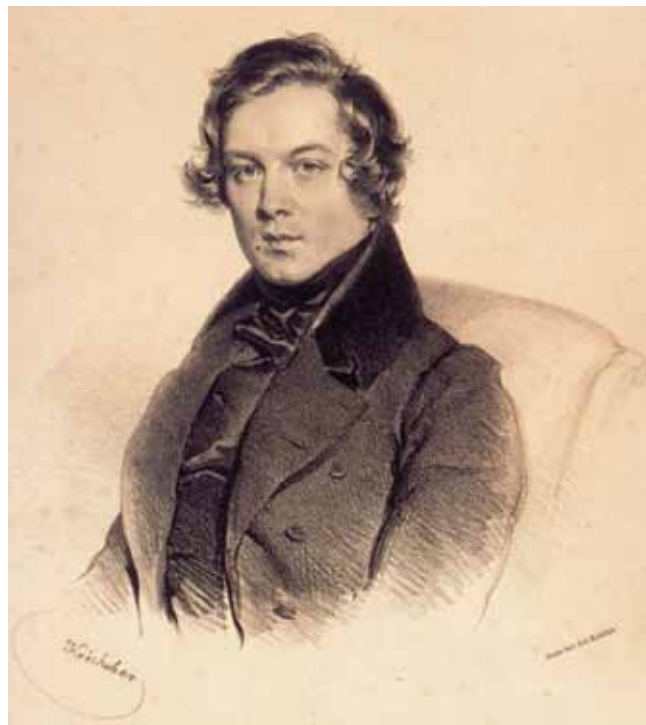
Robert Schumann, Lithographie von Joseph Kriehuber, 1839

Unter der Leitung von Felix Mendelssohn Bartholdy war Robert Schumanns Sinfonie „ Frühlingssinfonie “ B-Dur op. 38 am 31. März 1841 mit großem Erfolg im Leipziger Gewandhaus uraufgeführt worden. Beflügelt von dem Angebot des Leipziger Verlagshauses Breitkopf & Härtel, die Publikation vorzubereiten, begann Schumann schon im folgenden Monat mit der Komposition eines weiteren Orchesterwerks. Dabei spielte auch eine Rolle, dass ein Musiker die größte Anerkennung auf dem Gebiet der Orchesterkomposition erringen konnte. Nach der „ Frühlingssinfonie “ wurden „ Ouvertüre, Scherzo und Finale “ op. 52 in kürzester Zeit entworfen und niedergeschrieben. Die eröffnende Ouvertüre wurde am 12. und 13. April 1841 skizziert und lag