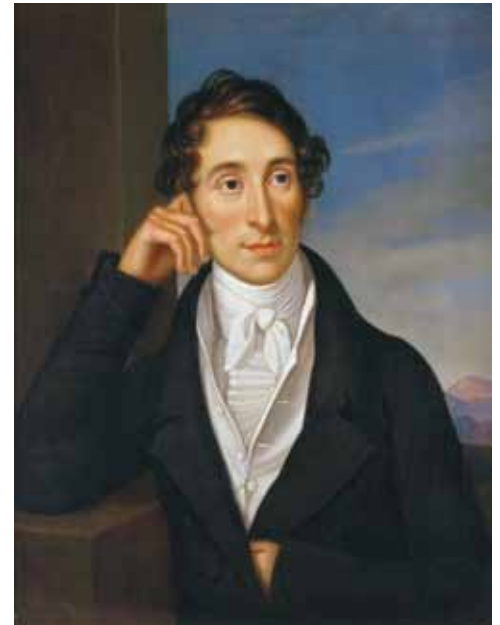
Carl Maria von Weber, Gemälde von Caroline Bardua, 1821