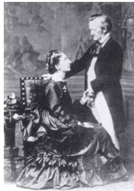
Richard und Cosima Wagner, 1872

Das „Siegfried-Idyll“ entfaltet einen starken Zauber, wie er selbst für einen Musikdramatiker vom Range Richard Wagners durchaus nicht die Regel ist. Auch beim Publikum erfreut sich das „Siegfried-Idyll“ dauernder Beliebtheit, wobei es bei Aufführungen in unterschiedlicher Besetzungsgröße zu erleben ist. Richard Wagner schwebte wohl eher eine größere Besetzungsstärke vor. Die ursprüngliche Kammerbesetzung war wohl einzig den beengten Räumlichkeiten in Tribschen verschuldet.