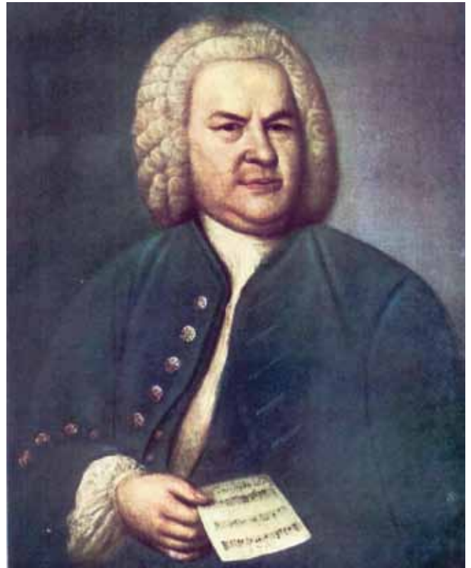
Johann Sebastian Bach, Ölgemälde von Elias Gottlob Haußmann, 1746